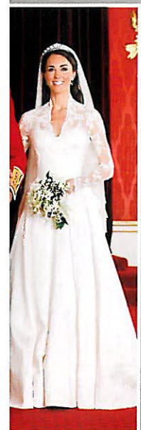
AM E KATE abril 2011

FOTOS OFICIAIS PARAÇÕES INEVITÁVEIS E DOIS CASAMENTOS REAIS